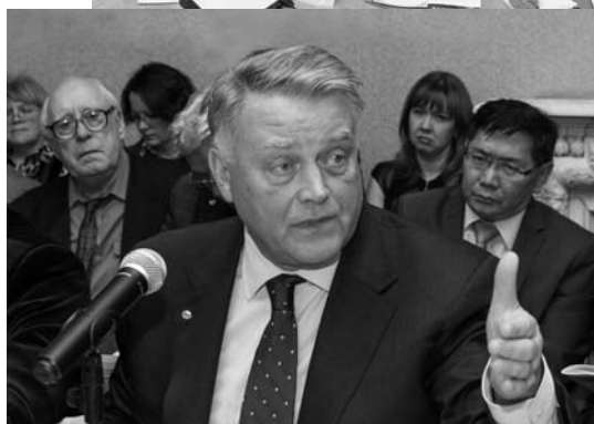
V.I. Yakunin is giving his speech Выступает В.И. Якунин

«The recovery of Siberia and the Far East — is our national priority for all XXI century ... The resources of the state and private business should go to development and the achievement of strategic objectives. The problem to be solved is unprecedented in scale and, therefore, our steps must be substandard».