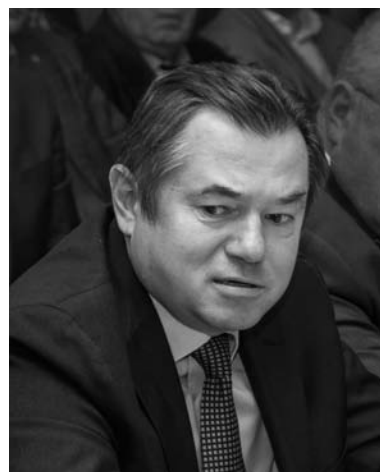
S.Y. Glaziev is giving his speech Выступает С.Ю. Глазьев