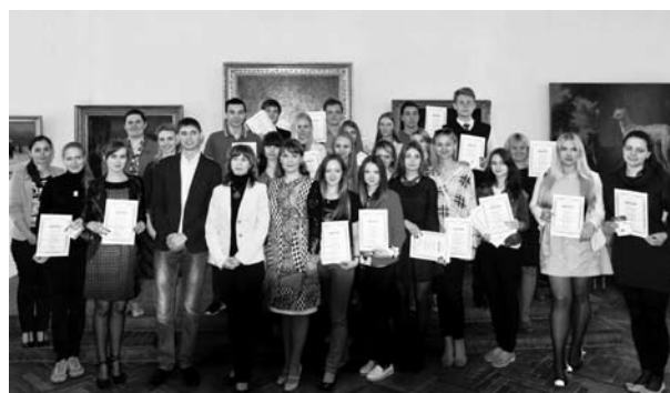
Winners of quest game «Quarter of Arts», Orel Победители игры-квеста «Квартал искусств», г. Орёл

Все участники были награждены дипломами, а победители — дипломами и памятными призами, также активным пользователям мобильного приложения «YouGid» были вручены фирменные футболки от ООО «СКБ Информационные технологии».