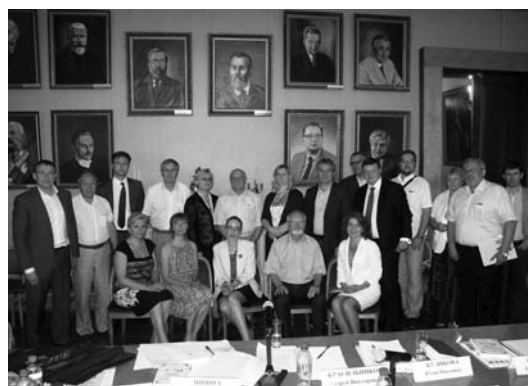
The participants of the Founding Meeting, the Fireplace Hall of the House of Economists, June 23, 2016

По итогам заседания была принята резолюция и план работы до конца 2016 года.