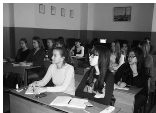
The participants of the Conference, Ivanovo Участники Конференции, г. Иваново

Конференция организована Ивановской региональной организации Вольного экономического общества России.