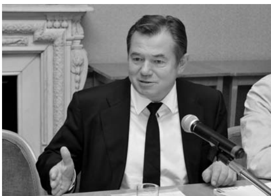
S.Y. Glaziev is giving his speech Выступает С.Ю. Глазьев

«... As far as the system of state governance is concerned, the most important thing lies not only in taking final decisions and communicating them to the addressees with outcome monitoring, but their preliminary preparation, including the substantiation of these decisions as well. Taking into account the present state of things in this sphere, I would run the risk of saying that Russia will start resolving the current economic deadlock from recreating a normal, integrated, consistent and logical system of state governance that is not misleading for the citizens, including the system of preliminary preparation, substantiation and discussion of decisions being taken».