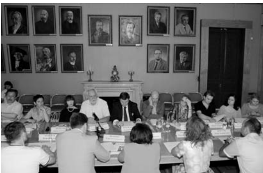
The participants of the Founding Meeting, the Fireplace Hall of the House of Economists, July 4, 2016

On July 4, 2016, the House of Economist hosted a founding meeting of the IUE Committee on Economics and Spirituality, which was held in the Fireplace Hall. The following people were elected to executive positions in the Committee: