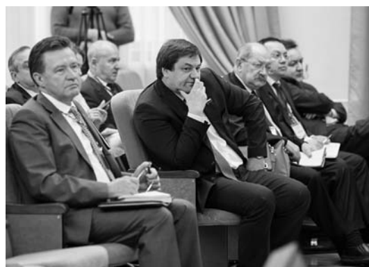
The participants of the Conference Участники Конференции

Свое выступление первый заместитель Председателя Совета Федерации Н.В. Федоров начал со слов: «Хочу от имени Совета Федерации воздать должное РЭУ имени Г.В. Плеханова за то, что вы занимаетесь изучением экономики в прочной привязке с реалиями экономического развития нашей страны. Научная школа Университета стала настоящим ядром отечественной экономической мысли. Здесь у вас особая атмосфера, особый дух, что и формирует творческую устремленность студентов и аспирантов, ученых и педагогов». Н.В. Федоров значительное внимание уделил взаимоотношениям федерального центра и регионов, отметив, что в Совете Федерации готовится доклад «Об основных направлениях государственной региональной политики Российской Федерации». Докладчик обратил внимание на увеличение разрывов между уровнями социально-экономического развития субъектов Российской Федерации; на то, что доля доходов местных бюджетов по отношению к ВВП уменьшилась в 2 раза; на проблемы реализации плана по созданию высокопроизводительных рабочих мест в регионах и другие вопросы.