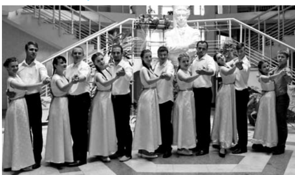
The Festival participants, Orel Участники Фестиваля, г. Орёл

The reports were made by 11 first-year candidates for master's degree studying at the Department of Finance and Credits. Each presentation was actively discussed by the students and professors. The speakers answered many questions, and the discussion turned out very fruitful for everyone.