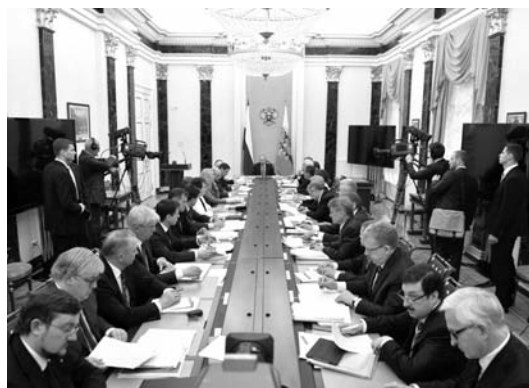
Meeting of the Presidium of Economic Council under the President of the Russian Federation, May 25, 2016

V.V. Путин сделал исключительно важное заявление о том, что в новых условиях рассчитывать на старые факторы роста не приходится и надо думать о новых. Это заявление означает отказ от многолетнего старого курса. Однако и здесь есть определенный минус — этот отказ происходит в неудачных формулировках. Получается, что курс был правильный, но сложились новые условия, в которых эти факторы перестали действовать. Нельзя говорить о том, что мы сталкиваемся с новой ситуацией, надо иметь смелость сказать, что этот курс с самого начала был бесперспективным, ничего стране не сулил, и если этого не сделать, то потом очень трудно искать выходы из создавшегося положения.