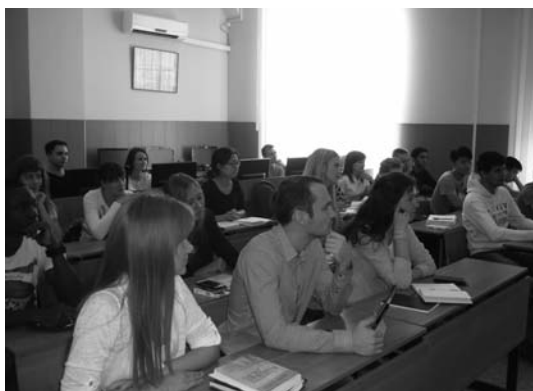
The participants of the Seminar, Ivanovo Участники Семинара, г. Иваново

The Organizing Committee highly evaluated the level of reports delivered by all participants of the conference, interesting and unconventional forms of illustrative materials, as well as active participation in the discussion.