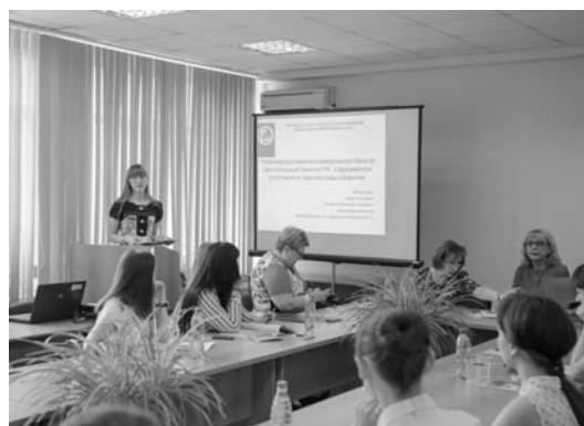
The participants of the Conference, Samara Участники Конференции, г. Самара

30 мая 2016 года в Самарском государственном экономическом университете (СГЭУ) прошла научная студенческая конференция «Финансово-кредитные отношения в условиях глобализации» . В ходе работы конференции было заслушано 23 научных доклада студентов СГЭУ, Международного института рынка, Самарского института «Высшая школа приватизации и предпринимательства», Поволжского государственного университета сервиса, Сызранского филиала Самарского государственного экономического университета.