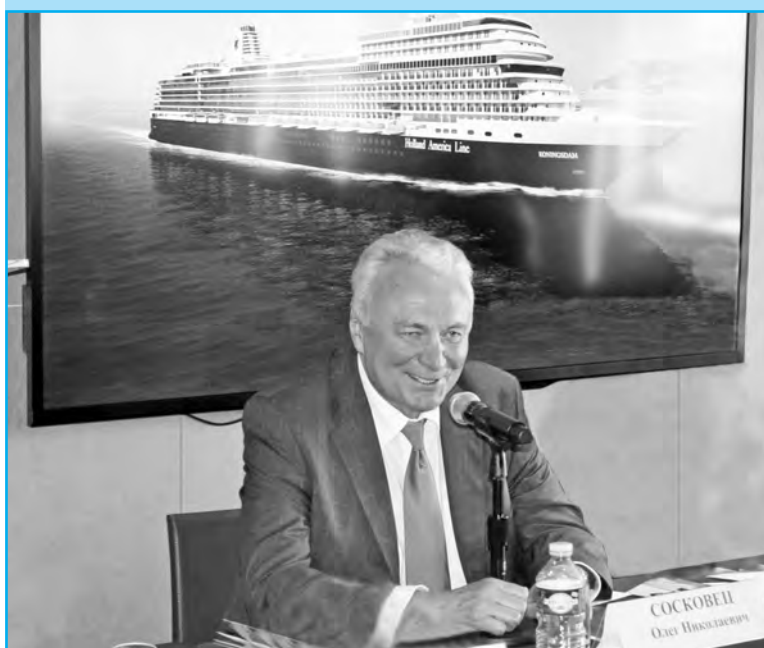
O.N. Soskovets is giving his speech Выступает О.Н. Сосковец

всего 1,8-2%, поэтому стремление к возвращению военного паритета – это необоснованные мечты. Другое дело, если мы будем вкладывать и инвестировать в военно-промышленный комплекс гигантские бюджетные средства – это позволит нам выйти на новые технологии и новый научно-технический уровень. «В ходе современной глобализации мир вышел на совершенно новый этап. Сейчас происходят революционные изменения всех технологических параметров действующего производства во всех отраслях и, если мы сумеем сконцентрироваться и вовремя перестроиться, у нас есть шанс вернуться в великие державы. В противном случае, при отсутствии переосмысления и инвестиций, мы мгновенно перелетаем в ряды третьих стран.» Учитывая всё это, Владимир Иванович призвал всех, прежде всего, заняться нашим собственным базисом и экономикой, а не подписанием международных всесторонних соглашений.