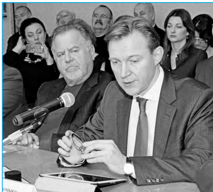
A.A. Gromyko is giving his speech Выступает А.А. Громыко

The third scenario is a new reset, and a rapprochement between the United States and Russia amid decreasing attractiveness of the European integration project. Russia is disappointed in Europe. The United States is also in some sense disappointed in Europe. Is it not a theoretical opportunity for rapprochement with each other? But the obstacles in this regard are obvious to all of us: the very American Messianism, the deeply rooted anti-Russian sentiments in the US, poor economic relationship between Moscow and Washington.