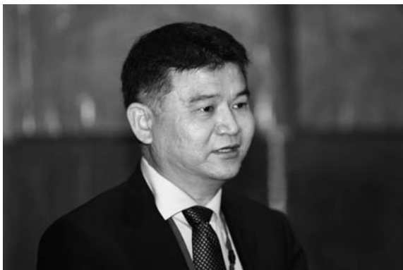
V.N. Ilyumzhinov is giving his speech Выступает В.Н. Илюмжинов

And although Russian mass media do their best to prevent the distribution of information on this movement, it has become a distant lighting in twilight. «It is hard to say now whether it will become a spark that will ignite the era of anti-bureaucratic revolutions of the 21st century predicted by famous futurologist Alvin Toffler or it will fade away. But Hope has surely appeared. An engagement for all true intellectuals, all honest people is protecting and supporting this movement. It is necessary to follow the way that has already been chosen by the best part of the population from developed countries, the best part of intellectuals, the far-sighted part of the business. Seize the Wall Street — and save yourself, children, people, Russia and mankind in the 21st century».