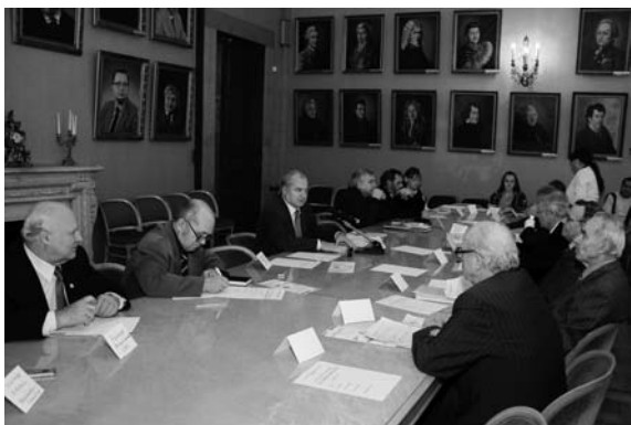
Participants of the Round table Участники Круглого стола

The Round Table was held with the participation of leading scientists and economists from Moscow State University, educational and research institutions of the Russian Academy of Sciences and the Russian Agricultural Academy, municipal and economic executives, mass media.