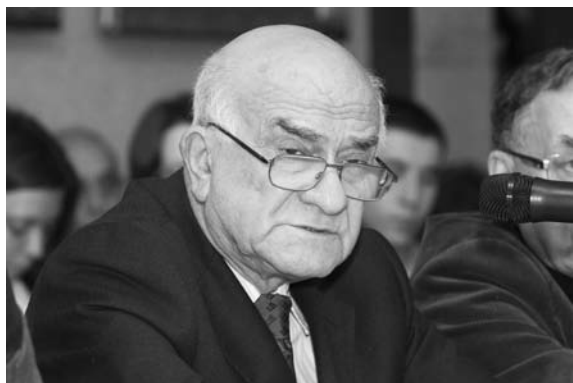
E.G. Yasin is giving his speech Выступает Е.Г. Ясин

The Free Economic Society of Russia has invited a famous economist, Member of the Board of VEO of Russia, Scientific Adviser of the National Research University Higher School of Economics, Director of the Expert Institute attached to the Russian Union of Industrialists and Entrepreneurs, Dr. Sc. (Econ.), Professor E.G. Yasin as the main speaker of the Round Table.