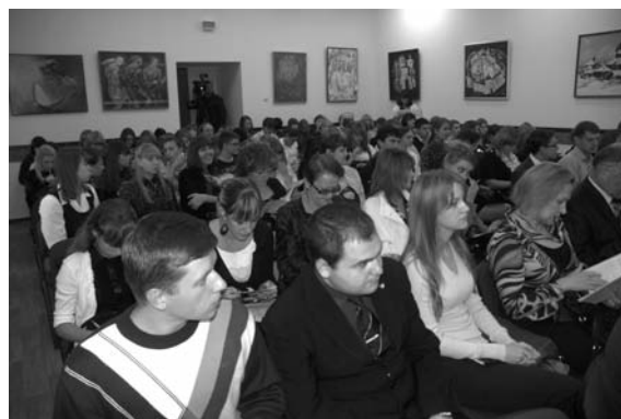
Participants of the Conference Участники Конференции

Настоящая конференция получила финансовую поддержку Российского гуманитарного научного фонда (проект № 11-12-46501 г/Ц), деятельность которого направлена на максимальное привлечение финансовых ресурсов регионов для разработки исследовательских проектов, посвященных актуальным проблемам развития экономики России. В конференции приняли участие свыше 100 человек из различных регионов Российской Федерации и Украины.