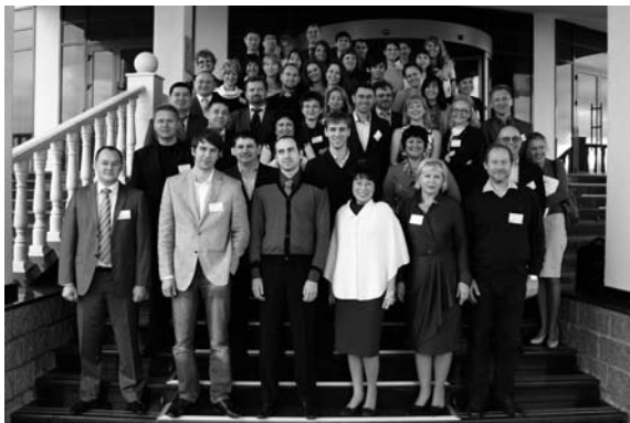
Participants of the Conference Участники Конференции