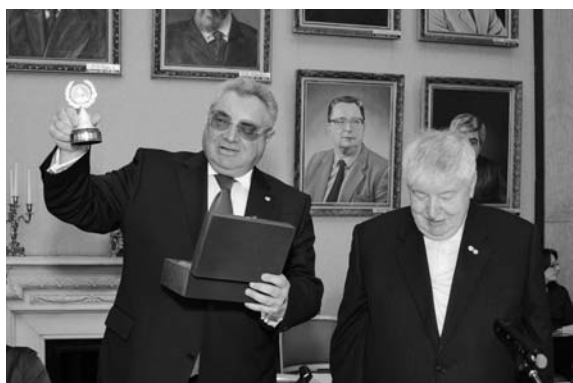
Awarding G.Kh. Popov with the Silver Medal of the VEO of Russia Вручение Г.Х. Попову Серебряной медали ВЭО России

The Round Table devoted to the presentation of books «In the Gale of the Epoch» and «A Century-Wolfhound Throws Itself at Me. Rethinking the Destiny of Russia in the XXI Century» published in order to commemorate the birthday anniversary of President of VEO of Russia G. Kh. Popov took place on November 16, 2011 at the Fireside Hall of the House of Economist.