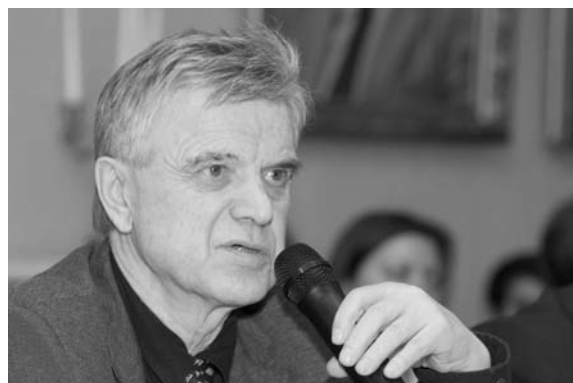
R.I. Khasbulatov is giving his speech Выступает Р.И. Хасбулатов

Первый вариант развития. Модернизация «сверху» , которая характеризуется инициативой исходящей от государства, большой долей государственных инвестиций и одновременно создает «треугольник недоверия» между бюрократией, бизнесом и обществом. Это развитие можно назвать развитием по инерции. По мнению докладчика, такой вариант развития модернизации «сверху», который не допускает институциональных изменений, в том числе политических, к успеху в России вести не будет.