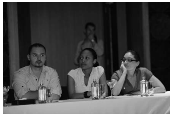
The participants of the XXI Meeting of IUE Участники XXI Собрания МСЭ

• Бюджет Международного Союза экономистов на 2012 год.