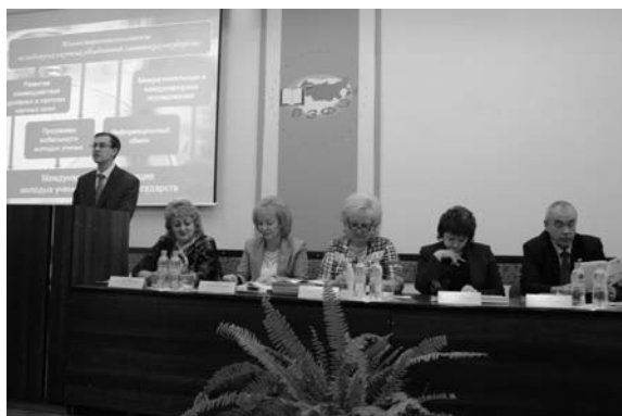
The participants of the Plenary Session Участники пленарного заседания

Learning Institute of Finance and Economics (VZFEI) in Kursk. It was organized by the Administration of Kursk Region, branch of VZFEI in Kursk, Public Chamber of Kursk Region, Kursk regional public organization VEO of Russia, Russian Humanitarian Scientific Foundation, and Election Committee of Kursk Region.