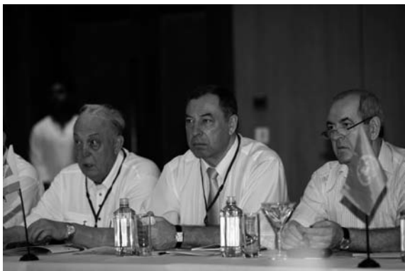
The participants of the XXI Meeting of IUE Участники XXI Собрания МСЭ

The in-depth constructive discussion at a high state, scientific and business level allowed analyzing the problems, trends and opportunities of the social and economic development of the world community and working out recommendations, which will contribute to the optimization of solutions to social and economic problems, effective reformation of the world and Russian economies.