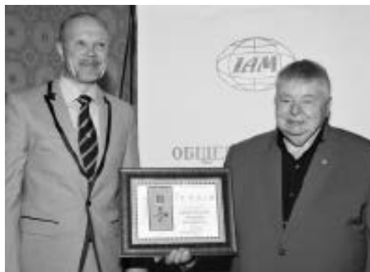
Awarding the order «For diligence for the Good of the Motherland» Вручение ордена «За усердие во благо Отечества»

В связи с юбилеем Издательский дом «Экономическая газета» наградил Международную Академию менеджмента орденом «За усердие во благо Отечества» .