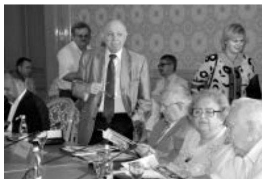
Participants of the Meeting Участники Собрания

По мнению докладчика, на фоне основных трендов, пессимистического и умеренно-оптимистического, актуальнейшая задача для российской экономической мысли – исследование возможностей реализации именно оптимистического сценария развития страны.