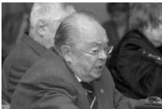
N.P. Shmelev is giving his speech Выступает Н.П. Шмелев

The main report to the theme of the Round Table was made by N.P. Shmelev . He began his speech with the following question: «What does Russia need from Europe today?» where he provided the detailed consideration of issues connected with the new system of collective security in Europe, the integrity of the European Union, political problems, and cultural cooperation.