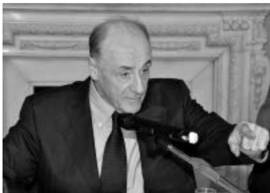
G.N. Tsagolov is giving his speech Выступает Г.Н. Цаголов

to the reporter, countries can be competitive in the world market system if they have managed to preserve an effective tradeoff between both purely market-based, capitalistic foundations and the elements of a socialist planned economy. The unquestionable argument in favor of this thesis is the development of the Chinese economy.