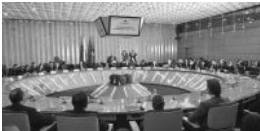
The awarding ceremony of winners of the contest in the premises of Moscow Government Торжественная церемония награждения победителей конкурса в здании Правительства Москвы

Today large-scale projects and programs are being implemented in the capital. They are not only necessary for a comfortable life of Moscow residents, but also are significant at the federal level.