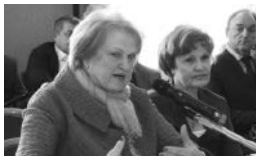
Kazimira Prunskiene is giving his speech Выступает Казимира Прунсене

В дискуссии по теме Круглого стола Казимира Прунсене , член Сейма Республики Литва, вице-президент МСЭ, вице-президент, академик МAM, д.э.н., профессор, отметила, что существует определенная асимметрия в ожиданиях Евросоюза и России. Прежде всего, необходимо гармонизировать торгово-экономические отношения и правовую систему. Кроме того, России необходима модернизация, в том числе и диверсификация производства, разработка альтернативных энергоресурсов.