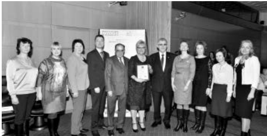
Awarding staff Scientific-practical center of medical and social rehabilitation of the disabled named L.I. Shvetsova (in the nomination «Team of the Year»)

Изменения, обусловленные современными тенденциями, происходят и в перечне номинаций конкурса. Большую популярность получила новая номинация «Команда года».