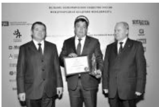
Awarding of absolute winner of the Contest V.Yu. Stromov, Rector Tambov State University Награждение абсолютного победителя конкурса В.Ю. Стромова, ректора Тамбовского государственного университета

In the present-day life it becomes important to realize the system policy, focused on implementation of new import substitution technologies, activation of scientific and technological capabilities and increasing of investment activity. Such policy will help Russia to settle down to a course of high economic growth based on modern technologies.